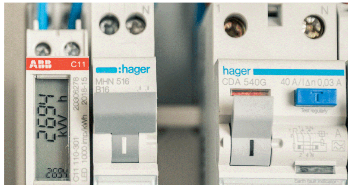
Stroommeter om ontwikkelingen te kunnen bijhouden.

Ook krijgt Aant regelmatig de vraag of de opbrengst van de zonnepanelen via een app af te lezen is. “Dat kan helaas niet”, legt hij uit. “We bieden wel een andere oplossing. In de meterkast zit een kleine stroommeter die de opbrengst registreert. Door deze regelmatig - bijvoorbeeld één keer per maand - af te lezen en te noteren, kunnen huurders de ontwikkelingen in het seizoen zien. Ook laat de stroommeter storingen zien die zijn ontstaan na bijvoorbeeld stroomuitval. Hoe sneller een storing opgespoord wordt, hoe sneller huurders weer kunnen profiteren van zonne-energie.”